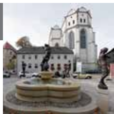
12 - 大教堂

大教堂是哈勒唯一一座大型早期哥特式建筑，大教堂的内部保存着巴洛克时期的珍品。直到宗教改革时期前，这座属于修道院的教堂一直是德国整个中部地区宗教和教堂艺术具有重大意义的中心。