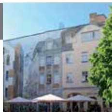
地址： Große Klausstraße - 壁画 Hallmarkt - 哥贝尔喷泉