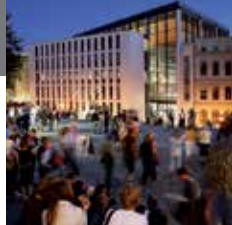
16 - 大学主楼

哈勒大学（全称：马丁·路德哈勒 - 维滕贝格大学）属于德国最古老的大学之一。大学广场四周分布着令人印象深刻的建筑群组，这些是：“狮子楼、梅兰希通教学楼、罗伯特教学楼以及大阶梯教学楼”。