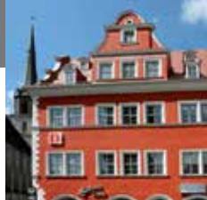
2 - 圣母玛利亚广场教堂 28 - 市中心广场小宫殿

旅游信息中心设在建于16世纪晚期的红色小宫殿内。位于它旁边的是名为“圣母玛利亚”教堂。在这里除了其他参观项目之外，更有马丁·路德原始逝者面模值得瞻仰。