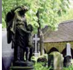
19 - 城市教堂墓地