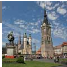
1 - 红钟楼

市中心广场的天际线主要由五座塔楼构成，他们分别是四座广场教堂塔楼和一座84米高的红钟楼。广场中心矗立着格奥尔格·弗里德里希·亨德尔纪念铜像