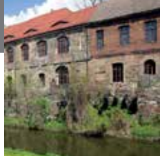
11 - 新官邸

新官邸建筑最初是由勃兰登堡红衣主教阿尔布雷希特准备作为天主教大学而设想建造的，她是德国早期文艺复兴时期最具有气势的建筑之一。院内的花园很有观赏价值。