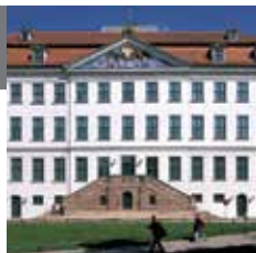
21 - 弗朗克基金会

在欧洲层面，弗朗克基金会是一个活跃的文化、研究机构，它被提名列入联合国教科文组织世界文化遗产名录。这里除了其他可参观内容之外，还有一个给人留下深刻印象的艺术与自然展厅。在它的奇珍异宝室内，收藏着上百年来来自中国的中文《圣经》。