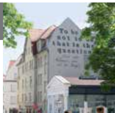
60 - 哈勒艺术岛，新剧院

这里跳动着哈勒戏剧的心脏。新剧院、歌剧院、木偶剧院、塔利亚剧院和国家交响乐团持续不断地在各个舞台更新轮换上演丰富多彩的节目。