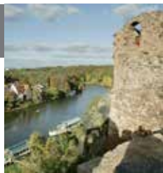
地址： Seebener Straße 1 - 哈勒哥比辛斯坦堡艺术大学坐落的哥比辛斯坦堡社区

哈勒有数目繁多的画廊和艺术场所。哈勒哥比辛斯坦堡艺术大学是一所具有国际声誉的艺术与设计大学。山上露天博物馆城堡在夏季对游客开放。