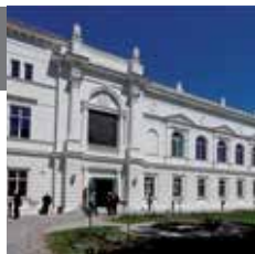
Адрес: Jägerberg 1

Леопольдина, основанная в 1652 году, является одной из старейших академий наук в мире. Начиная с 2008 года, Леопольдина в качестве Национальной Академии наук представляет Германию на международном уровне.