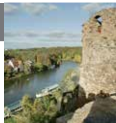
Agpec: Seebener Str. 1 – Квартал Гибихенштайн вокруг Высшей школы искусства и дизайна Бург Гибихенштайн в Галле

В Галле имеется множество галерей и выставочных залов. Высшая школа искусства и дизайна Бург Гибихенштайн в Галле имеет международную репутацию. Музей под открытым небом на Обербурге открыт летом для посетителей.