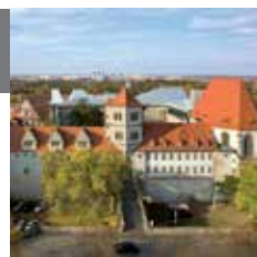
14 – Морицбург

Морицбург, построенный в позднем средневековье, одно время был резиденцией епископов Магдебурга. Сейчас в Морицбурге расположен государственный художественный музей с одним из наиболее значительных собраний классического модернизма.