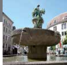
35 – Фонтан со скульптурой осла

В средневековье Старая рыночная площадь была центром города. Постройки в стиле Ренессанса и фахверка сохранились и по сей день. На, по всей вероятности, старейшей площади города Галле стоит фонтан со скульптурой осла, украшенный рельефом с надписью из легенды „Об ученике мельника с осликом, ступающем по розам“.