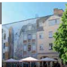
Адрес: Große Klausstraße – настенная картина Hallmarkt – фонтан Гёбеля

На улице Große Klausstraße стоит повнимательней взглянуть на большое настенное панно Ханса-Йоахима Трибша. А совсем рядом с ней – на площади Hallmarkt – расположен фонтан имени Гёбеля, наглядно рассказывающий об истории города Галле.