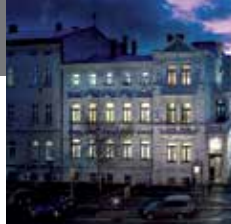
Адрес: Bernburger Straße 8

Художественный форум является одним из трёх крупнейших выставочных залов города. Здесь регулярно проводятся выставки, концерты, презентации, лекции и другие мероприятия.