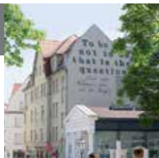
60 – Культурный остров Галле – Новый театр

Здесь бьётся театральное сердце города Галле. Новый театр, Оперный театр Галле, кукольный театр, театр „Талия“ и Государственная капелла предлагают зрителям свои самые разнообразные репертуары и программы.