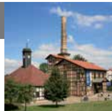
24 – Солеварня

Соль – „белое золото“ – когда-то сделала город Галле богатым. В Техническом музее солеваров и солеварения можно увидеть, как ведётся варка соли традиционным способом. Наряду с этим, в музее расположена выставка истории города, рассказывающая также о жизни солеваров.