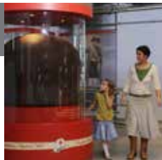
Адрес: Delitzscher Straße 70

Старейшая шоколадная фабрика Германии находится в Галле. Рядом с ней расположен музей, рассказывающий о сладостях и производстве шоколада, здесь можно также посетить шоколадную комнату.