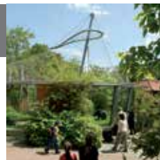
Адрес: Reilstraße 57

Для примерно 1 700 животных более 250 разновидностей с пяти континентов Горный зоопарк Галле стал родным домом. Зоопарк, территория которого достигает девяти гектаров, находится на горе Райльсберг, где извилистые тропинки ведут вдоль вольеров к обзорной башне.