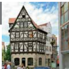
Адрес: Große Klausstraße 3

Жуткая история: Когда в Галле свирепствовала чума, то заражённым перекрыли кладкой улицу под названием Гразевег. Десять лет спустя жители разобрали стену и увидели эту улицу, поросшую травой и усеянную скелетами.