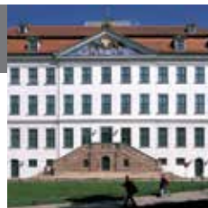
21 – Франкеше Штифтунген

Благотворительные и учебно-воспитательные учреждения, созданные Августом Германом Франке, являются живыми и действующими культурно-научными учреждениями европейского уровня, они предложены для внесения в список мирового культурного наследия ЮНЕСКО. Помимо всего прочего, здесь можно увидеть впечатляющие коллекции, посвящённые естественным наукам.