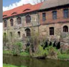
11 – Новая Резиденция

Новая резиденция, построенная кардиналом Альбрехтом фон Бранденбургом, первоначально должна была стать католическим университетом. Она представляет собой одно из наиболее импозантных архитектурных сооружений раннего Ренессанса в Германии. Также стоит заглянуть и в сад резиденции.