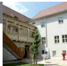
Адрес: Große Klausstraße 12

В доме, где жил композитор, сейчас находится музыкальный музей, рассказывающий о музыкальной истории города. При этом наряду с Бахом, в центре внимания находятся и такие композиторы, как Шайдт, Райхардт и Лёве.