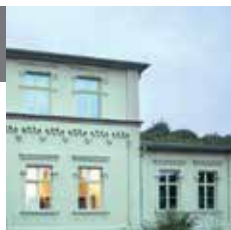
Адрес: Talstraße 23

Общество искусств „Тальштрассе“ принадлежит к крупнейшим культурным обществам Саксонии-Анхальт. На вилле позднего классицизма можно посетить сменные выставки. Наряду с этим культурное общество организует и проводит лекции и дискуссии об искусстве и политике.