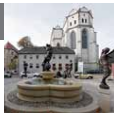
12 – Кафедральный собор

Кафедральный собор является единственной крупной постройкой ранней готики в Галле, хранящей в себе сокровища барочного искусства. Монастырская церковь до Реформации была наиболее значительным центром религиозных наук и церковного искусства Средней Германии.