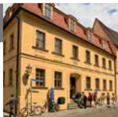
10 – Händel-Haus [дом Генделя]

В доме, в котором родился Георг Фридрих Гендель, сегодня расположена выставка, рассказывающая о жизни и творчестве знаменитого композитора эпохи барокко. Здесь также представлено собрание более 700 инструментов из нескольких столетий и около 1 000 рукописей.