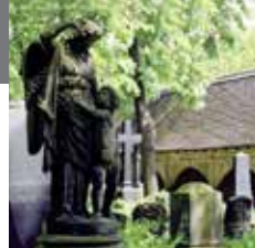
19 – Stadtkirchhof

Кампозанто является одним из самых красивых кладбищ эпохи Ренессанса в Германии. Автором его архитектурного оформления является Никкель Хоффманн. Здесь похоронены такие выдающиеся личности, как Август Херманн Франке, Кристиан Томазиус и отец Георга Фридриха Генделя.