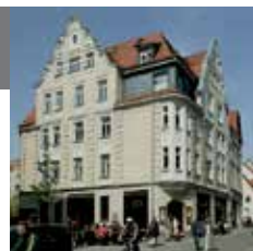
52 – Расположенный вблизи бывший институт физики

Стильные бары, уютные уличные кафе или рестораны встретятся Вам здесь почти на каждом углу. Неудивительно, что этот квартал является любимым местом для уютного отдыха. На небольшой улочке Kleine Ulrichstraße можно всегда найти место, где можно посидеть на свежем воздухе.